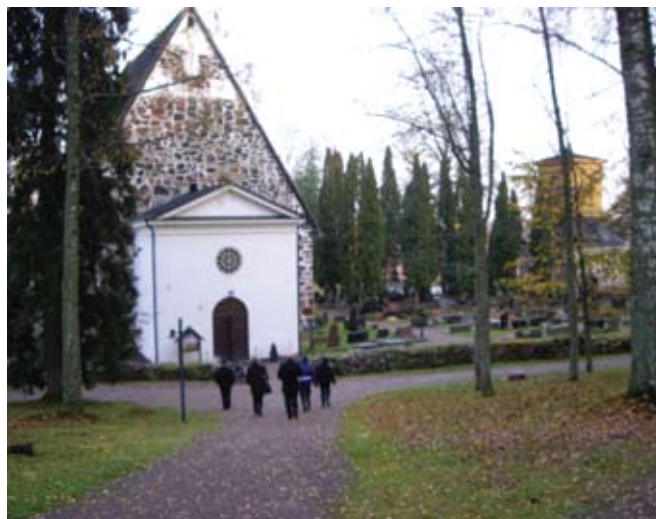
Ovan: Kyrkan i Pojo, S:ta Maria kyrka, byggdes på 1400-talet.