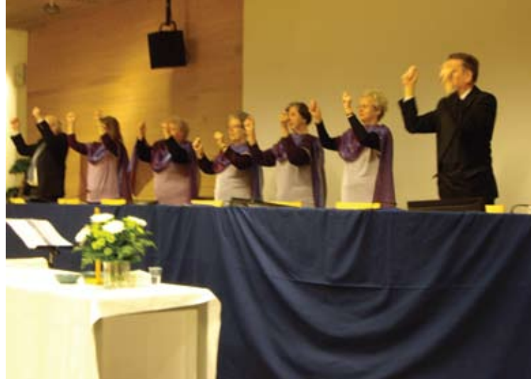
Teckenkören tecknade Hosianna.