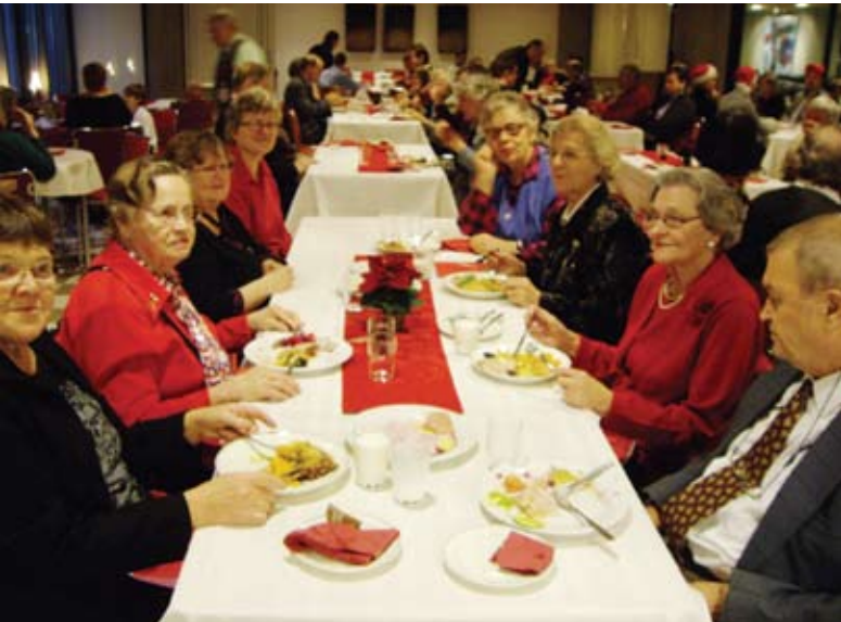
God julmat dukades upp.