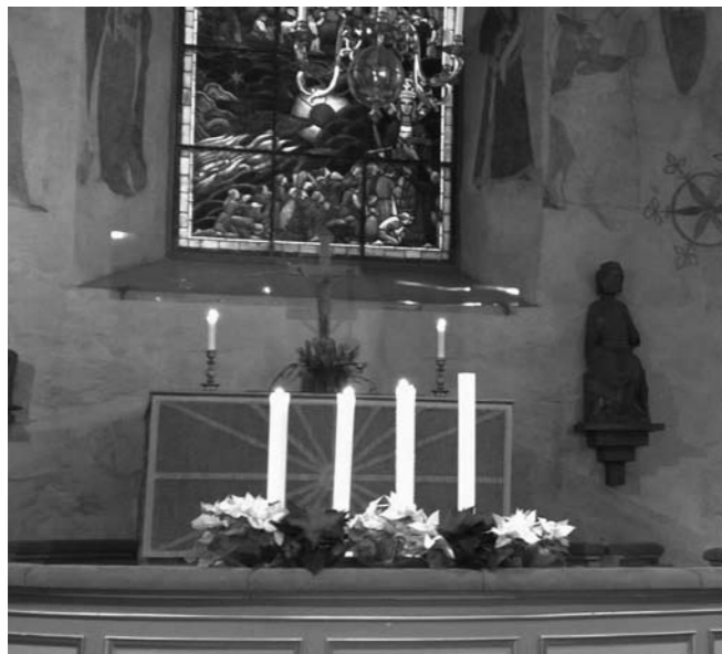
Tre ljus tända – det är tredje advent.