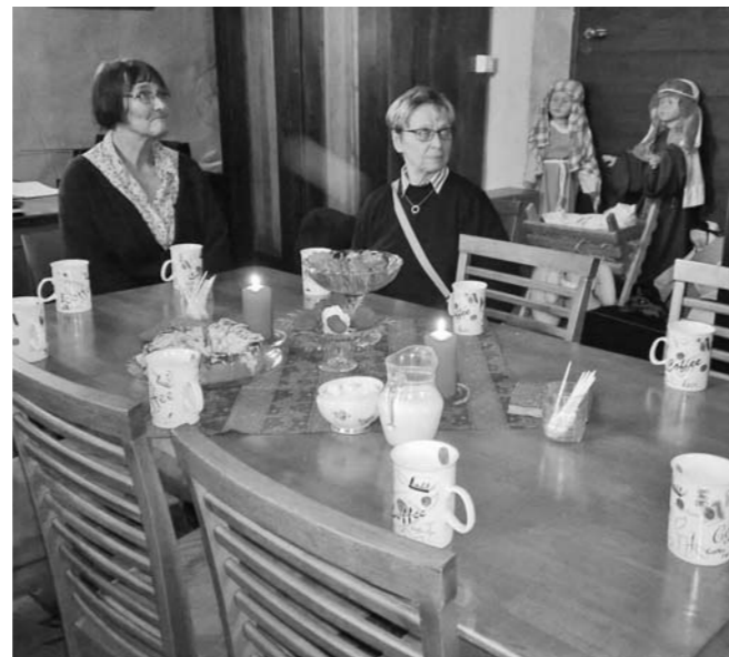
Damer vid kaffebordet och dockor föreställande Josef och Maria i bakgrunden.