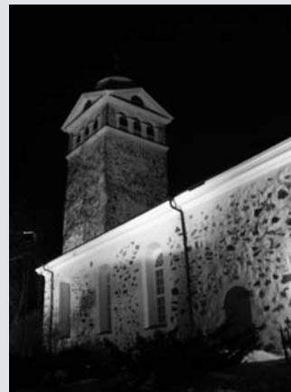
Bidrag nr 1: Ekenäs kyrka