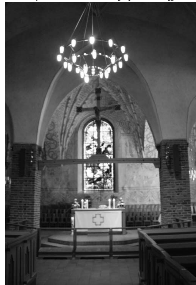
Esbo domkyrka med medeltida målningar på tak och väggar.