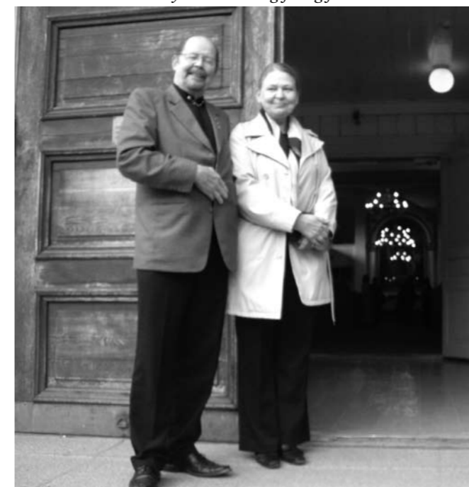
Paret Aro vid Gamla kyrkan, där de gifte sig för 45 år sedan.

På lördag 11 maj fortsatte programmet i Alexandersteatern med olika uppvisningar och tävlingsinslag. Man tävlade i flera olika kategorier; fotokonst, hantverk, roliga berättelser, teater och körframträdanden. Alla i publiken kunde före kl. 12 rösta på de programinslag eller de utställda tävlingsarbeten som de tyckte bäst om. Efter lunch med gott kaffe blev det prisutdelningar och högtidlig avslutning. Jag blev mycket glad över det första pris som jag fick i fototävlingen. Jag hade på vårvintern fotograferat formationer av is på en bergsvägg nära min f.d. arbetsplats i Tenala. Jag hade låtit göra ordentliga förstoringar av bilderna och ramat in dem till tavlor.