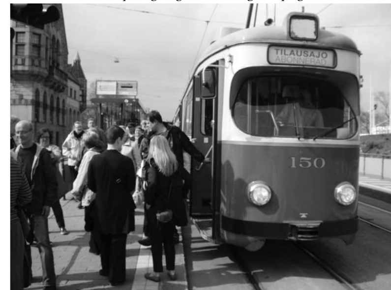
En rundtur med museispårvagn ingick i kulturdagarnas program.

I maj blev det sedan dags för Döva seniorers kulturdagar, ett evenemang jag nu deltog i för första gången. Det här var 15:e gången som dessa dagar arrangerades och platsen var nu Helsingfors. Här träffade man en mängd gamla bekanta och tiden gick fort när man ville byta några ord med alla. Dagarna inleddes på torsdag 9 maj hos Helsingfors Dövförening i Kronohagen med lunch och kaffe – det bjöds på soppa och plättar med sylt – mums! På eftermiddagens ordnades en utflykt med spårvagn – en härlig gulgrön gammal museispårvagn med bl.a. gardiner för fönstren. Här gällde det att köra med öppna fönster i den välfyllda spårvagnen – så sköttes ju luftkonditioneringen förr.