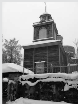
Bidrag nr 2: Lehtimäki kyrka

Tävlingen pågår under 2013. Vinnaren väljs i jultidningen. Vinnaren får ett hemligt pris. Delta du också i tävlingen och skicka in ett kyrkfoto! Mejla det till: maria.lindberg@evl.fi eller posta pappersfotot till: Maria Lindberg, Hamngatan 9, 00161 Helsingfors.