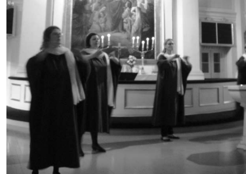
En teckenkör uppträdde i kyrkan.

Nästa gång ordnas Döva seniorers kultur dagar i Seinäjoki år 2015. Före det blir det en annan kulturfestival, nämligen Dövas kultur dagar som riktar sig