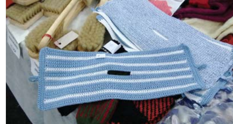
Grytlappar att sätta över kastrullocket. Stickade av Ansa Miely.