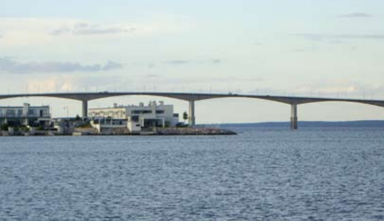
Invid Ölandsbron över Kalmarsund ligger flera moderna bostadsområden.