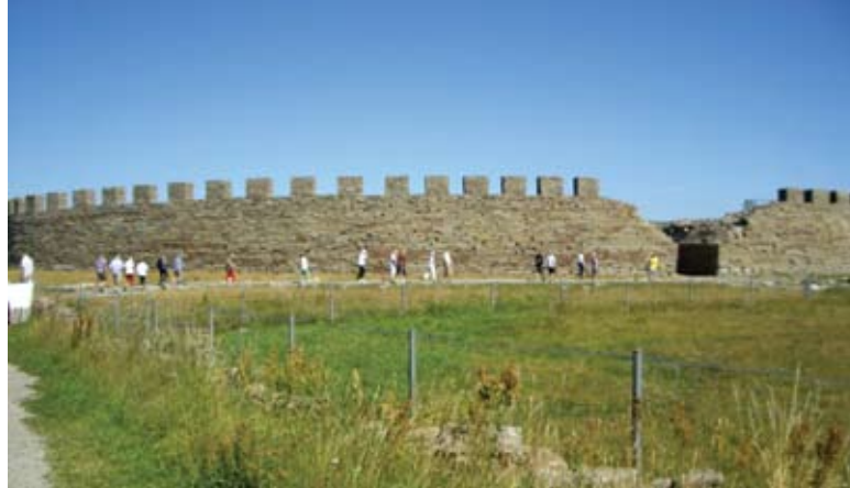
Eketorps borg är Sveriges enda totalt undersökta och rekonstruerade fornborg. Den är ett av Ölands mest uppskattade besöksmål.