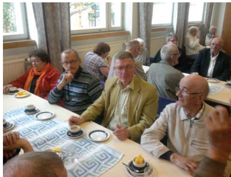
Döva från Vasatrakten och från Uleåborg vid kyrkkaffet.