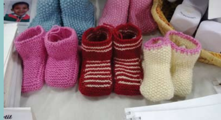
Söta babytossor stickade av Marja-Leena Lehtonen.