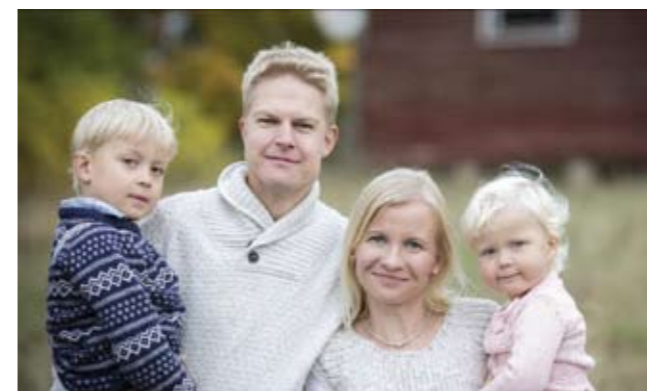
Familjen Lönnholm i somrigt landskap.

Jyväskylä för att lyssna på gudstjänst och ha gemenskap med andra teckenspråkiga.