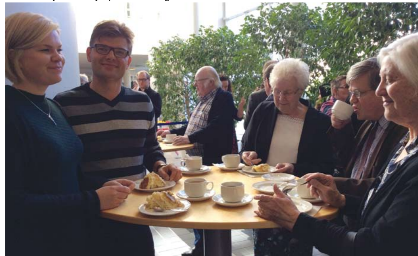
Glada ansikten på seminariet på Ljusa huset i Helsingfors.